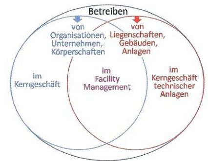
Abb. 1: Gliederung der Aufgabenbereiche des Betriebens

Die Schnittmenge der Aufgaben des Betriebens von Organisationen, Unternehmen oder Körperschaften mit den zugehörigen Liegenschaften, Gebäuden oder Anlagen, ist wie in Abb. 1 dargestellt, der Umfang des Betriebens