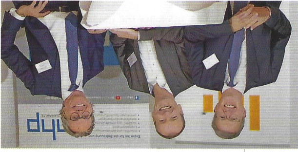
Heid & Partner Rechtsanwältin

klimafit.at/leitlinien-facilitymanagement fma.or.at/leitlinien-facilitymanagement